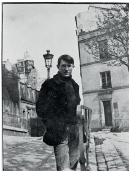
Picasso à Montmartre, place de Ravignan, Anonyme, 1904, photographie

Pierre DAIX, Dictionnaire Picasso , Paris, Éditions Robert Laffont, 2011, p. 68