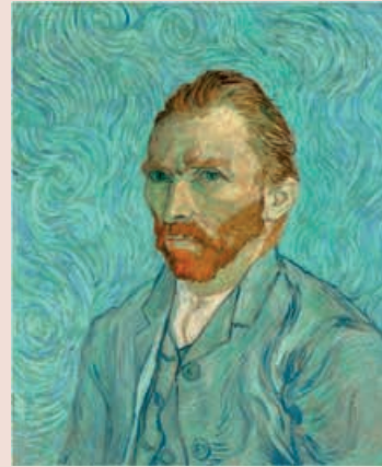
Autoportrait , Vincent Van Gogh, huile sur toile, 1889, musée d'Orsay

Peintre et dessinateur néerlandais. Son œuvre est inspirée par l'impressionnisme et annonce le fauvisme et l'expressionnisme. Certains de ses autoportraits célèbres peuvent être mis en regard avec l' Autoportrait de 1901 de Picasso ( Autoportrait au chapeau de feutre , 1887 ; Autoportrait , 1889).