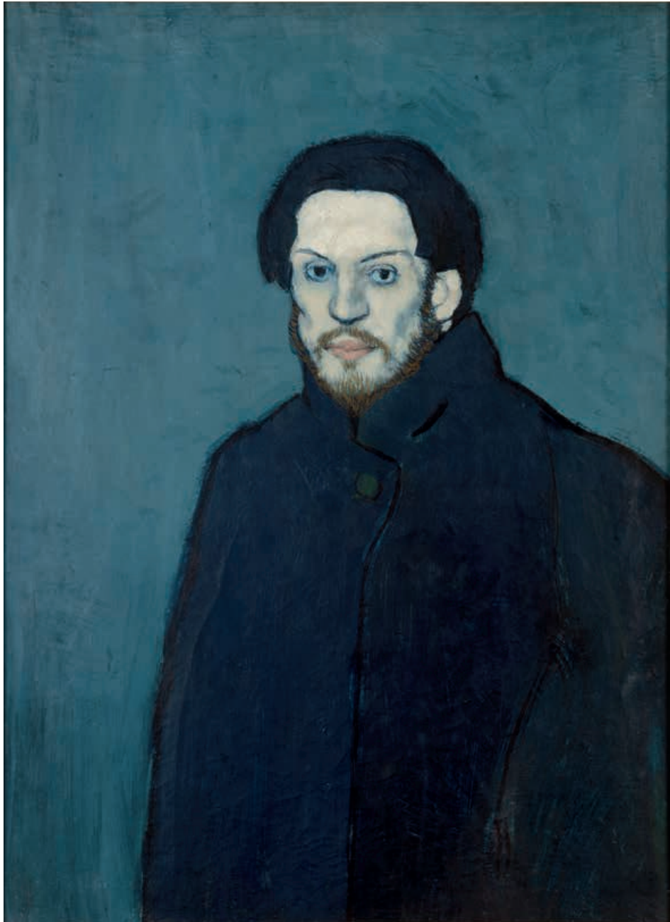
Autoportrait Pablo Picasso, 1901 Huile sur toile 81 x 60 cm Musée national Picasso-Paris

© Succession Picasso-Gestion droits d'auteur