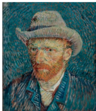
La mort de Casagemas , Pablo Picasso, 1901, huile sur bois, Musée national Picasso-Paris

© Succession Picasso